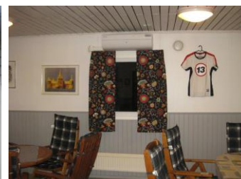
Ny gardiner för höst säsongen